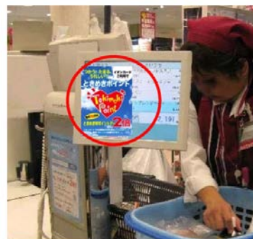
レジ横サイネージ(イメージ)