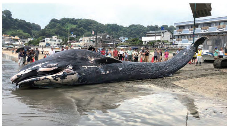
くじらの赤ちゃんの胃の中から プラスチックごみが発見されました