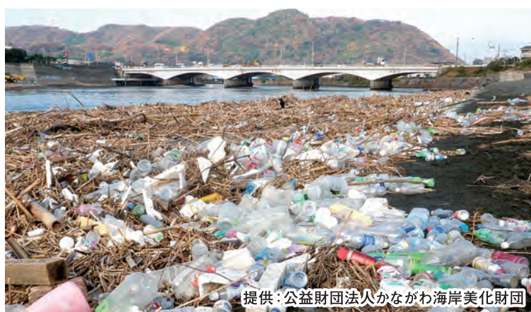
河口付近には流域から流れてきた プラごみが多数漂着しています