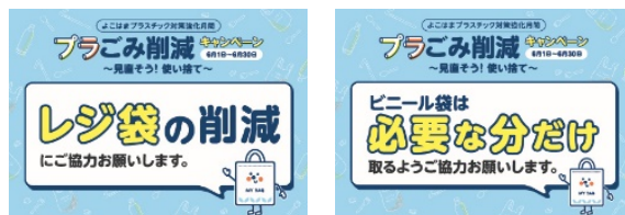
▲ポップデザイン(例)

プラスチックによる環境汚染の現状や、使い捨てとなるワンウェイプラスチックの削減に向けて取り組んでいただきたいことを、わかりやすくお伝えするポスター、ポップを掲示します。(ポスターデザインは別添のとおり)